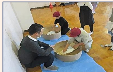
【3年生・昔の道具体験】