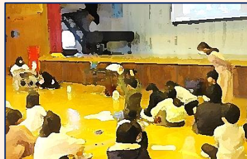
【5年生・テレビ朝日出前授業】