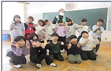
【1年生・むかし遊び体験】