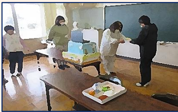
【全校児童・給食感謝の会】