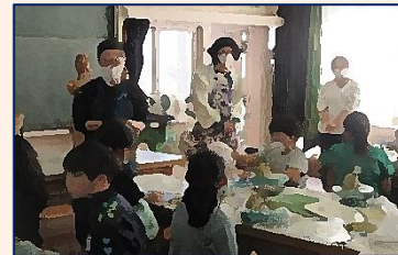
【4年生・埴輪づくり体験】