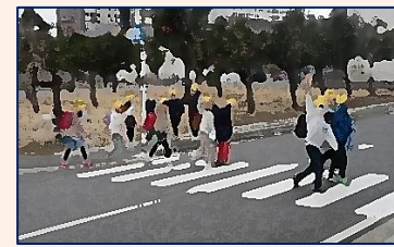
【念願叶った関間横断歩道】