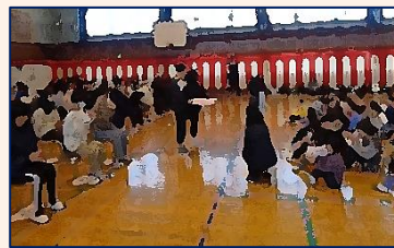
【6年生&1・2・3年生「お別れ式」】