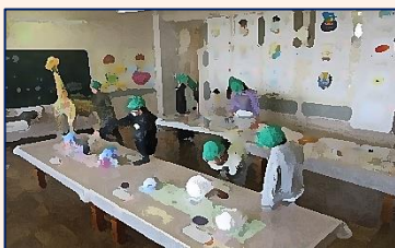
【中学生の美術作品展示会】